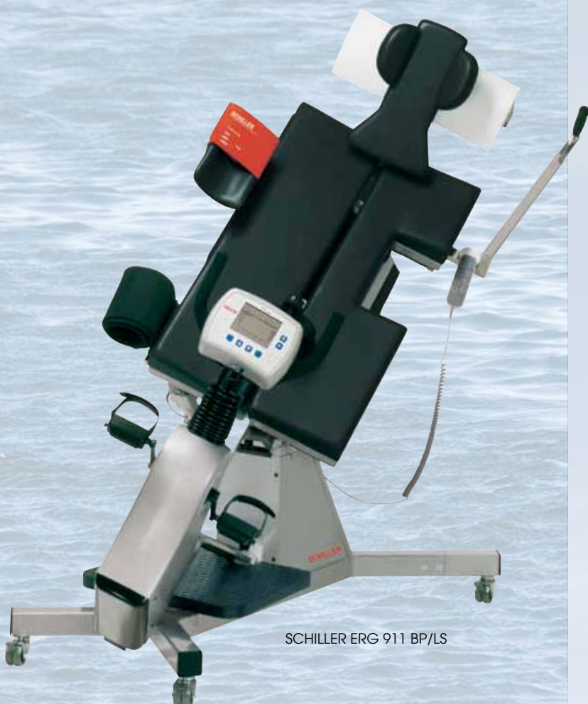
SCHILLER ERG 911 BP/LS

Der Einsatz einer Belastungs- Echo-Liege wird auch für ältere und behinderte Patienten empfohlen.