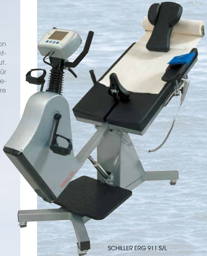
SCHILLER ERG 911 S/L

Das neue Sicherheits-Liege-/Halbliege-Ergometer von SCHILLER wurde gemäss den jüngsten europäischen Richtlinien für medizinische Ergometer entwickelt und gebaut. Durch einfache Einstellbarkeit eignet es sich besonders für Belastungs- und Herzkathetertests in der Kardiologie und Rehabilitation sowie für Patienten mit hohem Risiko und ältere oder behinderte Menschen.